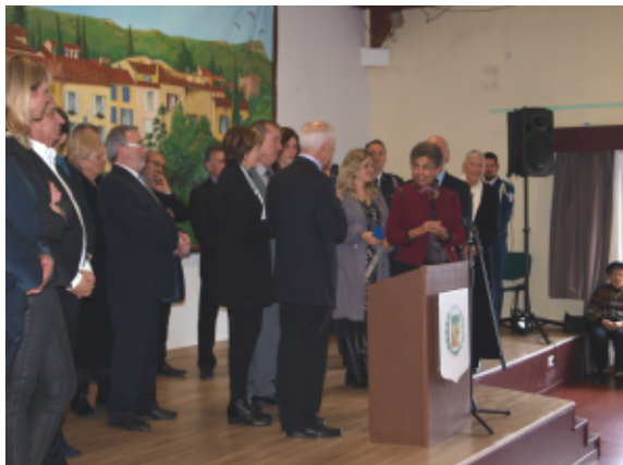
Voeux du Maire