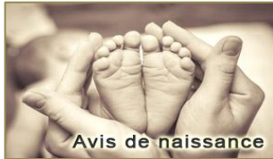
Avis de naissance