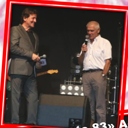
Concert «Route 83» Août