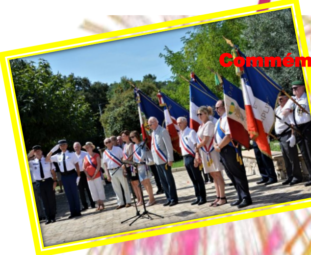
Commémoration du 17 août