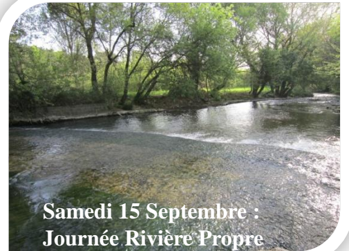
Samedi 15 Septembre : Journée Rivière Propre

Samedi 15 Septembre : Journée Rivière Propre A partir de 10h. Pré de la Font