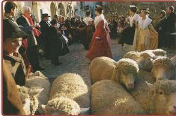
Noël en Provence