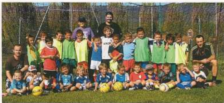
Photo du groupe des débutants du F.C. Ste Anastasia et du staff technique, qui parcourt les terrains du centre Var tous les samedis avec beaucoup d'enthousiasme et qui s'améliore et progresse à chaque match.