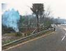
Elagages Entrée Village