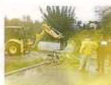
Inondations Novembre 2011