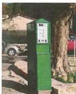
LA « CROTTIBOITE »