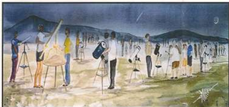
By Michel DECONINCK