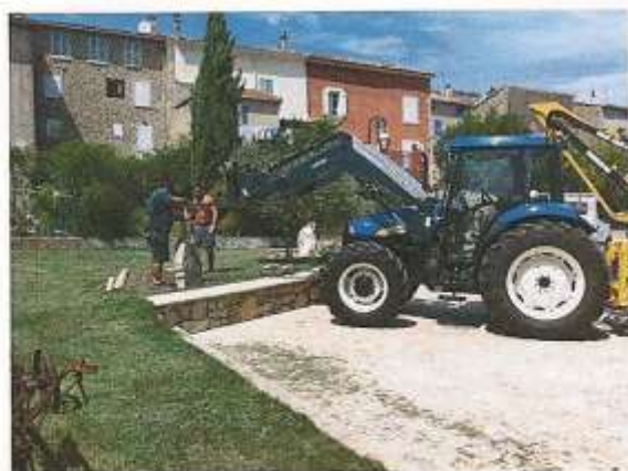
Nouveau parc matériel des services techniques

- Travaux divers : Préparation des festivités locales : Fête de la St-Just, Nuit des Etoiles, Boucles de l'Issole, commémoration du 17 août 1944, Préparation des locaux pour le C.L.S. H, révision des locaux avant la rentrée scolaire, pose d'une stèle « Harkis » place des Ferrages