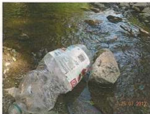
Photographie prise dans l'Issole