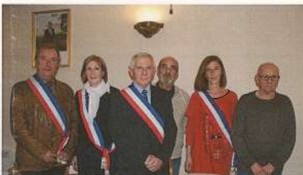
Le Maire et les Adjoints