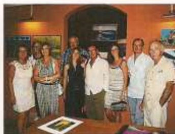
Collectif "hors cadre" de Solliès-Pont