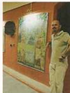
Franck Picault peinture, décoration, trompe-l'oeil, panoramique, patines, stuc, fausses matières www.franckpicault.fr