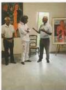
Michel Potier artiste-peintre figuratif contemporain - Peinture et Gouache www.michelpotier.com