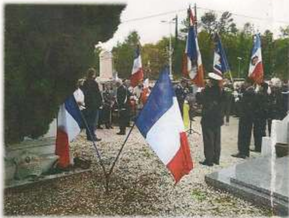
Commémoration du 11 novembre 1918