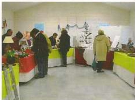
Salon des Artisans-Créateurs des 6 et 7 décembre 2014 salle A. Garnier

Ce fut pour nombre de visiteurs une surprise sympathique de découvrir à la fois la qualité du travail et l'esthétique de la salle Garnier.