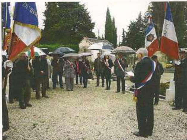
Célébration de la Journée Nationale d'Homage aux "Morts pour la France" au cours de la Guerre d'Algérie et des Combats du Maroc et de la Tunisie le 5 décembre