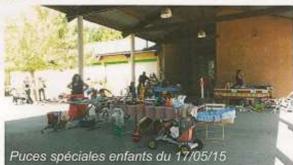
Puces spéciales enfants du 17/05/15

A VENIR : Fête des écoles le vendredi 26 juin à partir de 16h30 dans les cours des écoles.