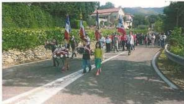
Cette année, une affluence record à la commémoration du 8 mai 1945.