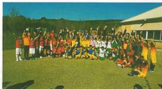
Tournoi Futsal le 8 novembre à Sainte Anastasia