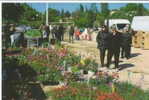
Foire aux plants du 24 avril 2016