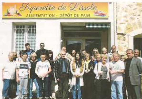
Inauguration le 13 avril 2016

Horaires : Tous les jours : 7h30 - 13h et 16h-20h Dimanche 8h30-13h